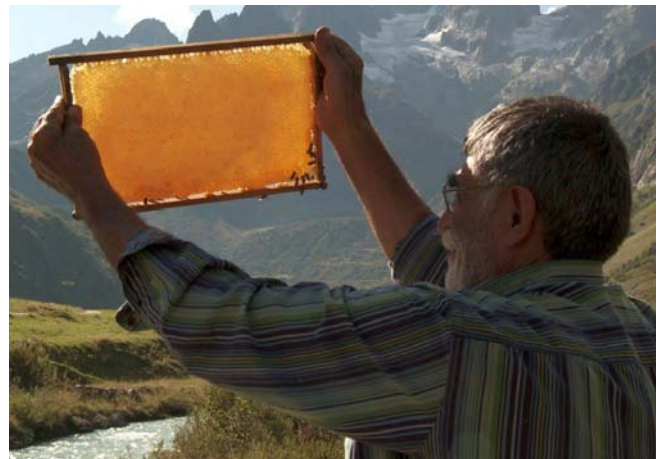
Filmstill aus DER IMKER

Dies wurde auch am 21.4.2015 in Zürich ersichtlich: Das ZRWP zeigte den Film im Rahmen von FILM IM FOKUS und lud dazu den Regisseur zu einer Diskussion mit dem Publikum ein. Mano Khalil gewann die Herzen der zahlreich anwesenden Besucher/innen unter anderem dadurch, dass er den Film in Bezug zu seinen eigenen Migrationserfahrungen setzte. Mit viel Humor thematisierte er unter anderem Probleme, denen man als Migrierende in der Schweiz begegnet, zum Beispiel bürokratische Herausforderungen. Wie im Film auch, sprach er solche Erfahrungen im Gespräch zwar direkt, aber nie anklagend an. Khalils Erzählungen im Film wie auch im