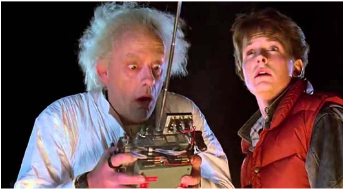
Filmstill aus BACK TO THE FUTURE (Regie: Robert Zemeckis, USA 1985)