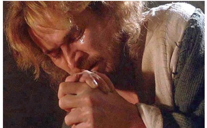
Jesus bittet Gott darum, ihn vor dem Kreuz zu verschonen (Filmbild aus THE LAST TEMPTATION OF CHRIST, US 1988, 01:46:34)