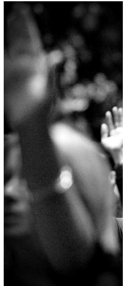
Hingabe bis zur Ekstase an einem Gottesdienst in Texas verbinden.

Ist das Modell der amerikanischen New Evangelicals, die sich als aktive Mitgestalter von Zivilgesellschaft verstehen, exportfähig? Ist es gar auf Europa und seine Evangelikalen zu übertragen? Die Verve von Marcia Pallys Referat regte an der Tagung jedenfalls zu einem faszinierenden transatlantischen Vergleich an. Der Berliner Praktische Theologe Rolf Schieder konstatierte auch in Deutschland, dass Evangelikale verstärkt Sozialprogramme lancieren, linke Themen aufgreifen,