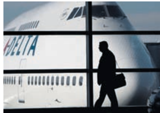
Club der Auferstandenen. Lehman, General Motors, Texaco und Delta Airlines waren schon einmal im Konkursverfahren – und existieren trotzdem weiter.

derschlagen als etwa in der Schweiz, die ja ebenfalls starke christliche Wurzeln besitzt, hat laut Pfeleiderer tatsächlich viel mit dem amerikanischen Puritanismus zu tun. Dieser habe sich mit dem typischen Pioniersdenken in den USA verbunden. So werde dem gescheiterten (Wirtschafts-)Helden die Vergebung in der Regel nicht verweigert, sofern er keine krummen Geschäfte gemacht hat. Umgekehrt sei die Schweiz stärker geprägt vom Gedanken der ausgleichenden Gerechtigkeit. Konkurs ist hierzulande gewissermassen das «Jüngste Gericht», in dem jedem nach seinen Taten vergolten werde und vor allem die «Gläubiger» – man beachte die Verwandtschaft des